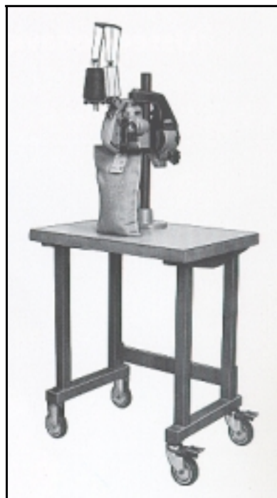
Clase 2200AT con Pedestal H1400T y mesa de perfiles de acero

Clase 2200AT , como 2200AS pero con interruptor de encendido y paro incorporado en el cabezal de la máquina de coser por medio de un palpador.